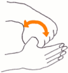
⑥親指と手掌をねじり洗いする