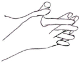
⑤指の間を十分に洗う